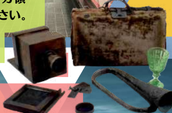
安政の大地震で沈没したディアナ号遺品の数々

1854年に日米和親条約が結ばれ日本最初の開港地となった下田は、激動の時代を迎えます。アメリカからペリーとハリス、ロシアからプチャーチン。何隻もの黒船が下田を出入りし、世界への玄関口としての役割を果たすことになるのです。日本語・オランダ語・中国語・英語、四ヶ国の言語が飛び交う日米和親条約付録下田条約の交渉風景、日露和親条約交渉中に下田をおそう安政の大津波、日本最初のアメリカ領事館設置……。目まぐるしくも華々しい幕末の下田のすべてを目撃してください。