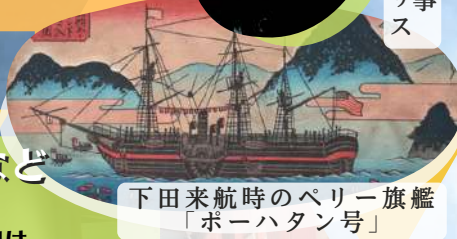
下田来航時のペリー旗艦「ポーハタン号」